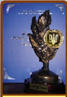
ЛІЦЕЙ - ФЛАГМАН ОСВІТИ УКРАЇНИ